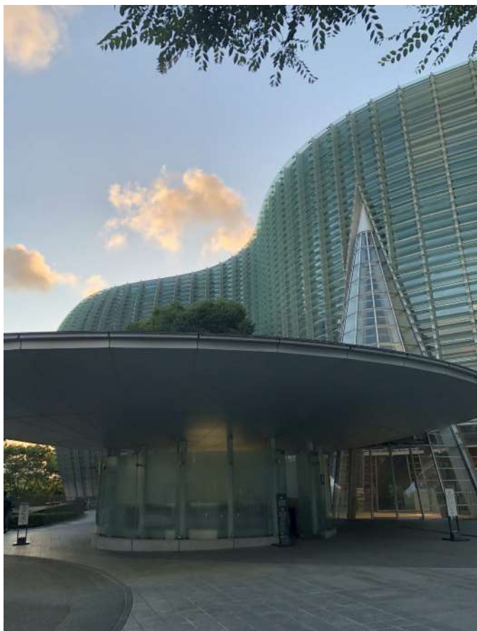
National Art center de Tokyo