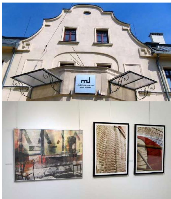
Exposition Packaging en Tchéquie, 2025

Cette année, l'exposition à Tokyo a eu lieu du 7 au 17 août 2025 et le Salon d'Automne accueillera les œuvres de 96 artistes japonais.